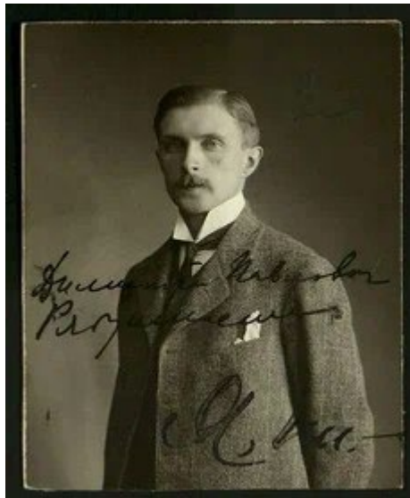
Рисунок 3. Дмитрий Павлович Рябушинский