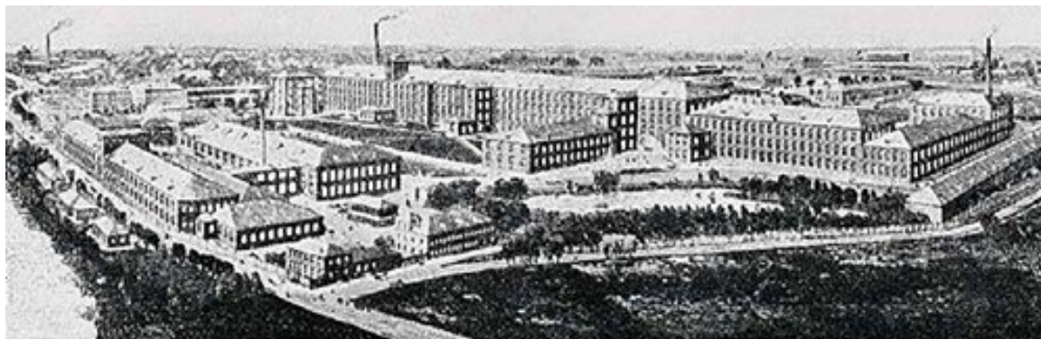
Рисунок 1. Вид фабрики «Товарищество мануфактур П. М. Рябушинского с сыновьями»