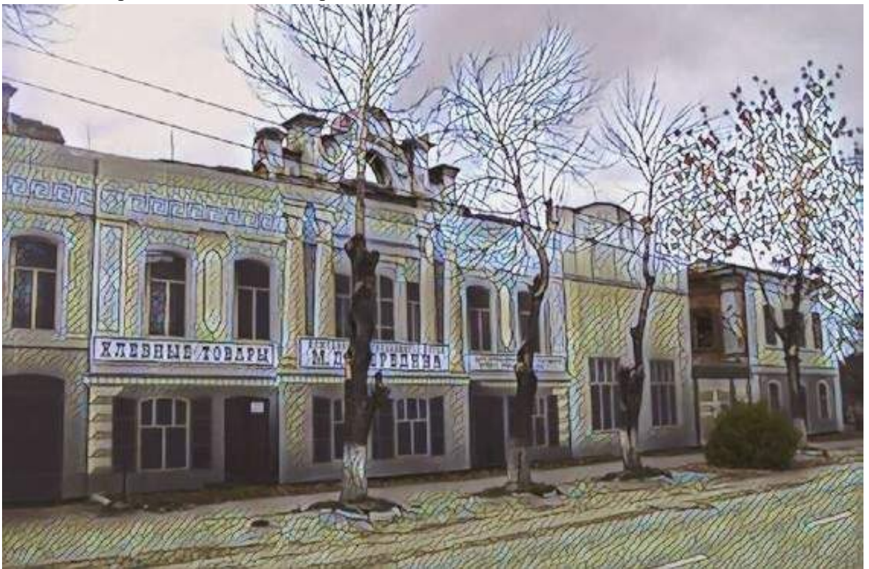
Особняк Мередина готовят к реставрации