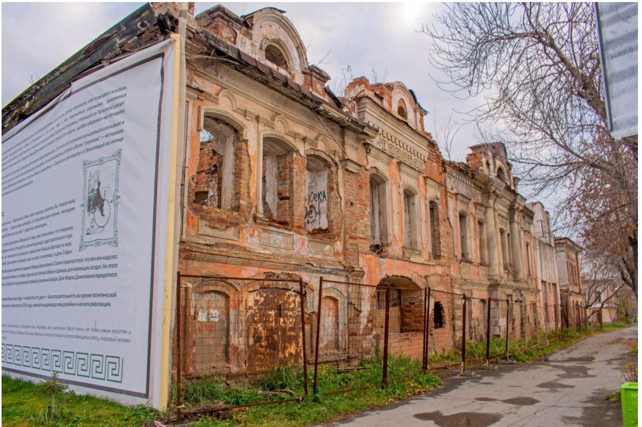
Особняк Мередина в настоящее время