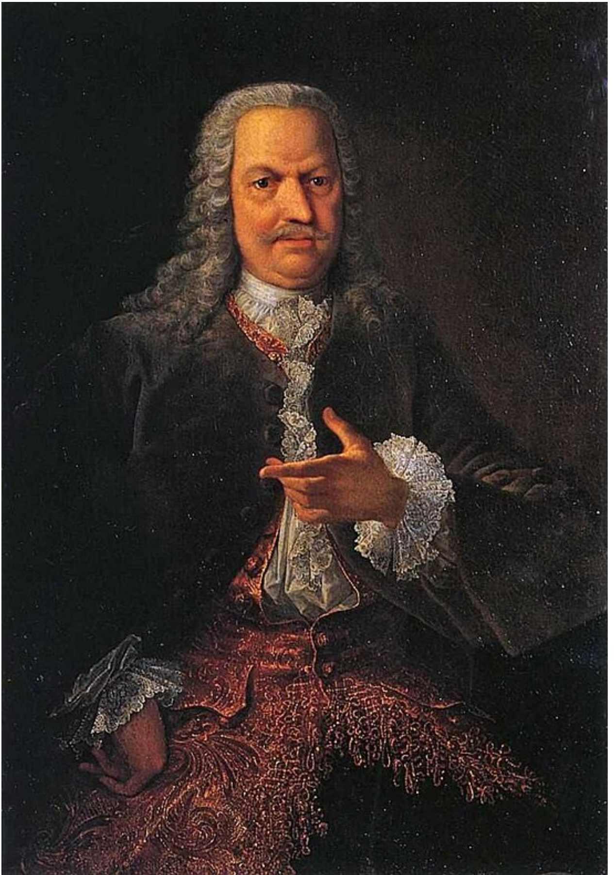
Акинфий Никитич Демидов - промышленник старший сын Никиты Демидова (Антюфеева). Портрет Акинфия Демидова кисти Георга Кристофа Гроота