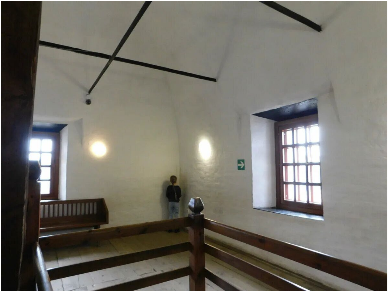
«Слуховая комната» — помещение в Невьянской башне в Невьянске Свердловской области.