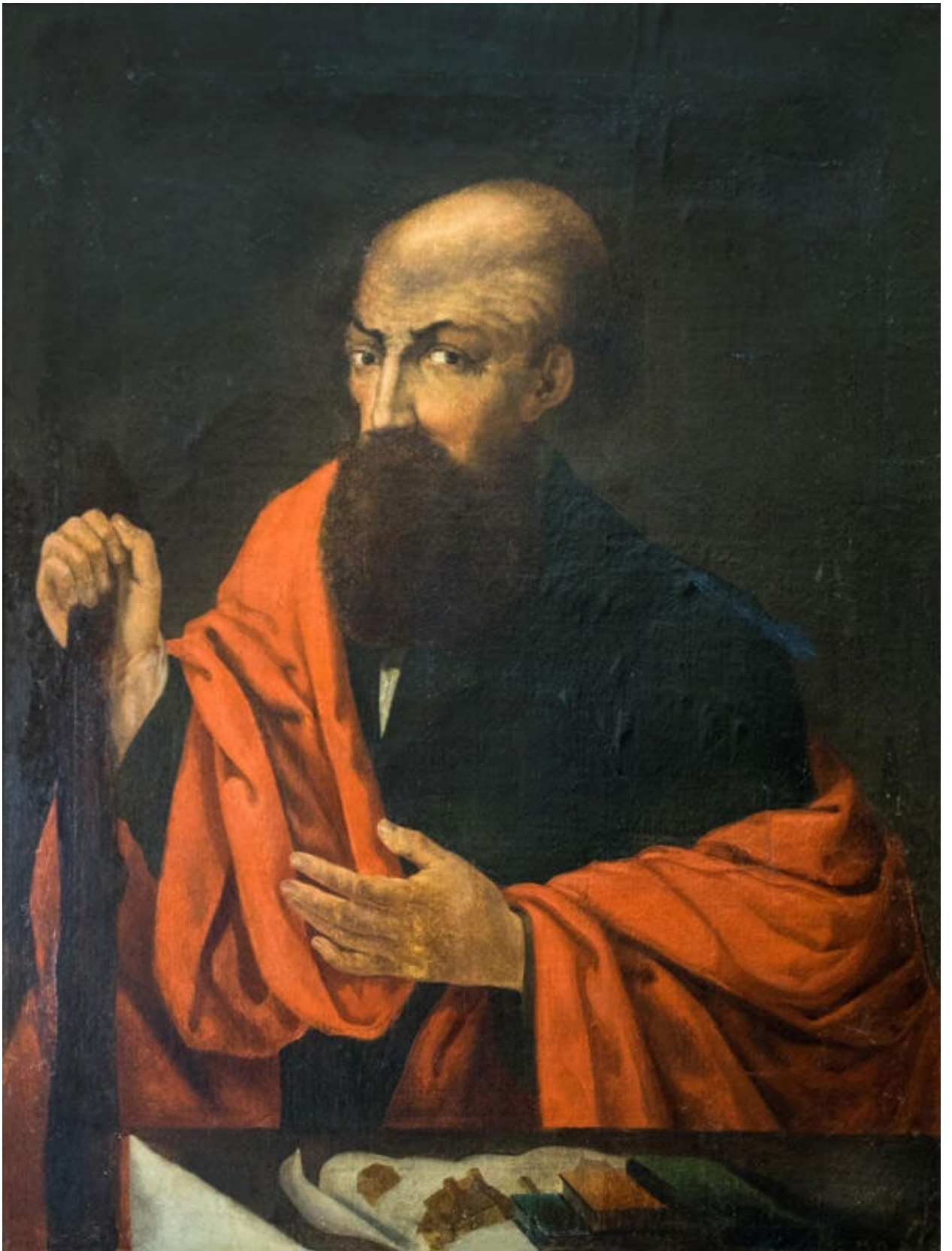
Никита Антуфьев — основатель уральской горной промышленности и знаменитой династии Демидовых. Первая четверть 18 века. Автор неизвестный художник.