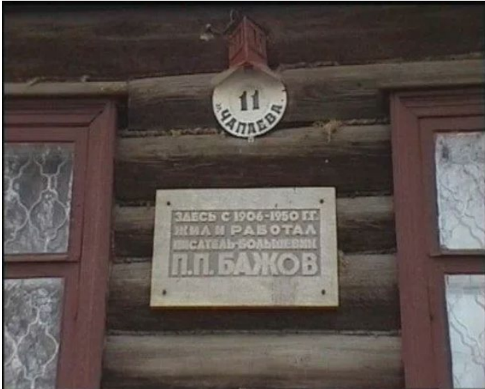
Мемориальная доска на доме в селе Шайдуриха невянского района. Бывшая школа, где работал П.П. Бажов.