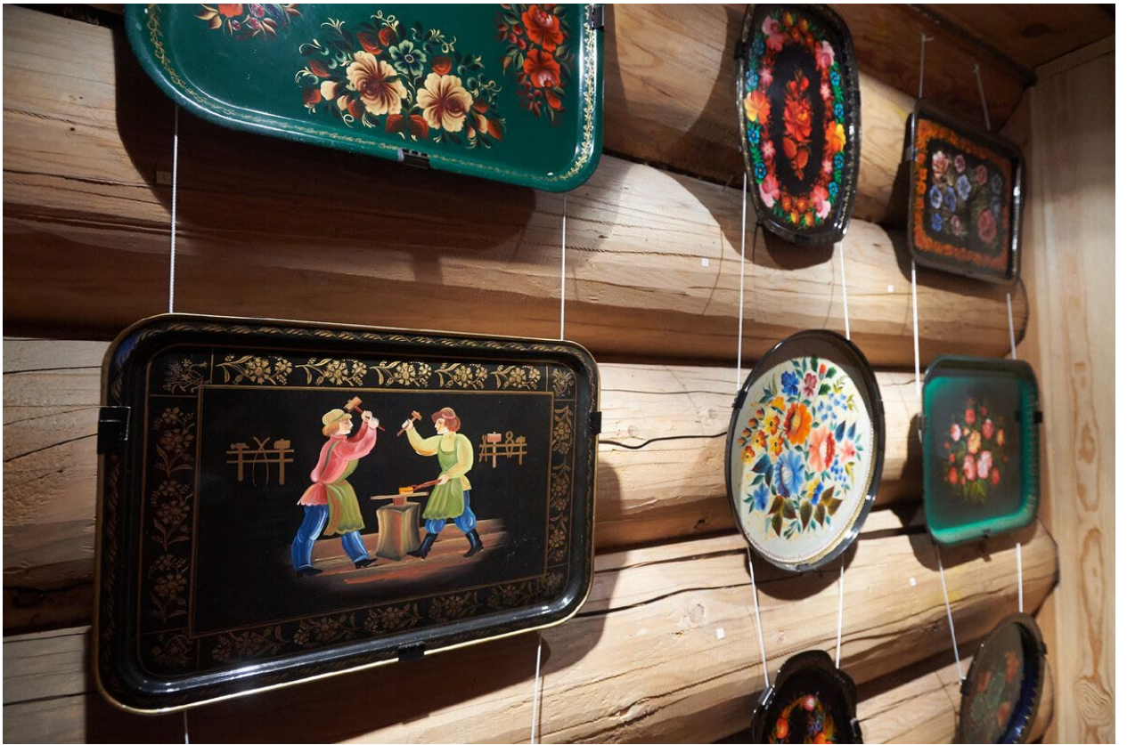
Железные подносы г.Нижний Тагил, Невьянск. Упоминаются в сказе П.П. Бажова «Хрустальный лак»