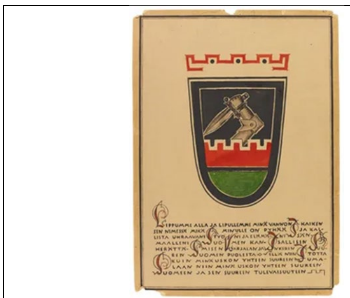
Текст клятвы «Академического Карельского Общества»