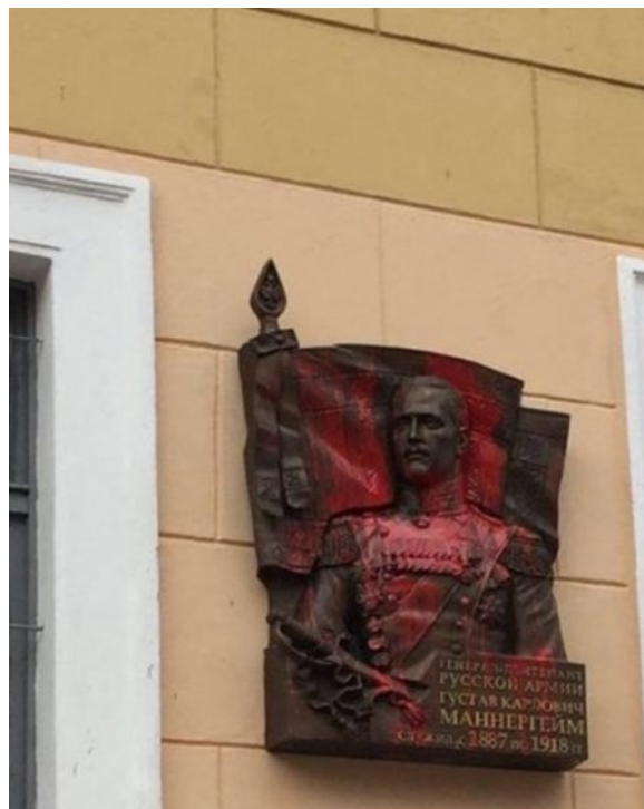
Памятная доска Маннергейму, установленная, а затем демонтированная в Санкт-Петербурге