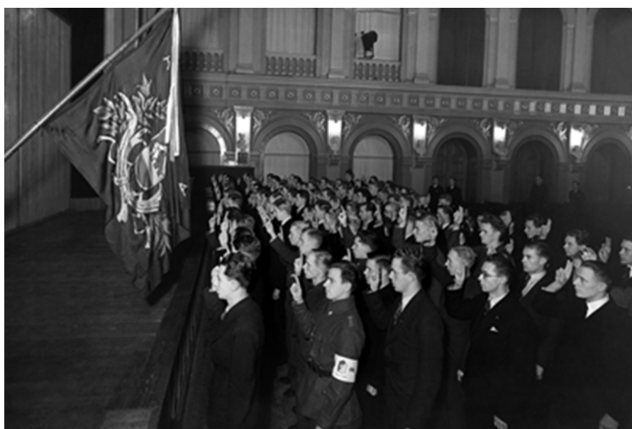
Собрание в 1939 г. Представительство абвера — КО «Финляндия»