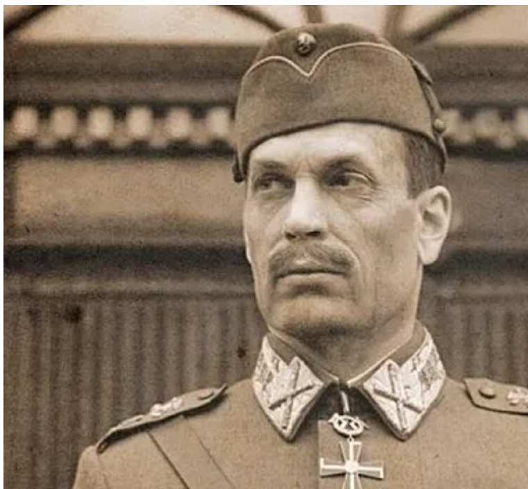
Маршал Карл Густав Маннергейм