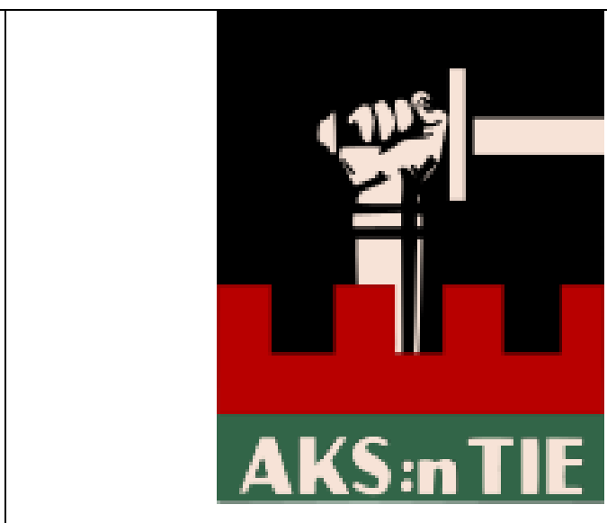
Герб Академического Карельского Общества»