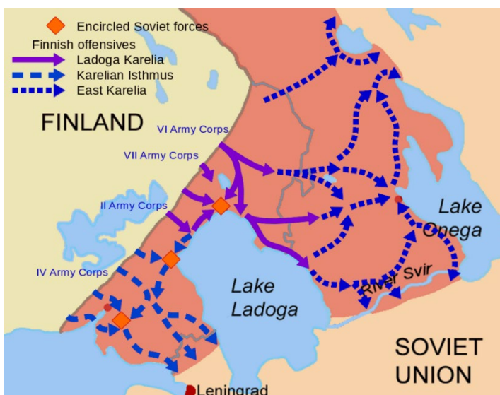
Наступления Финляндии на территорию СССР в период Второй Мировой войны