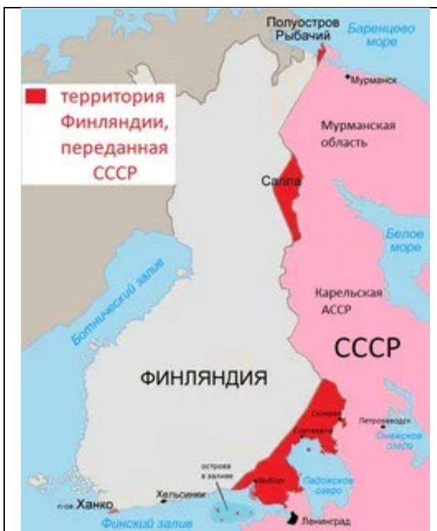
Территории, полученный СССР ПО Мирному договору между СССР и Финляндией 1940 г.