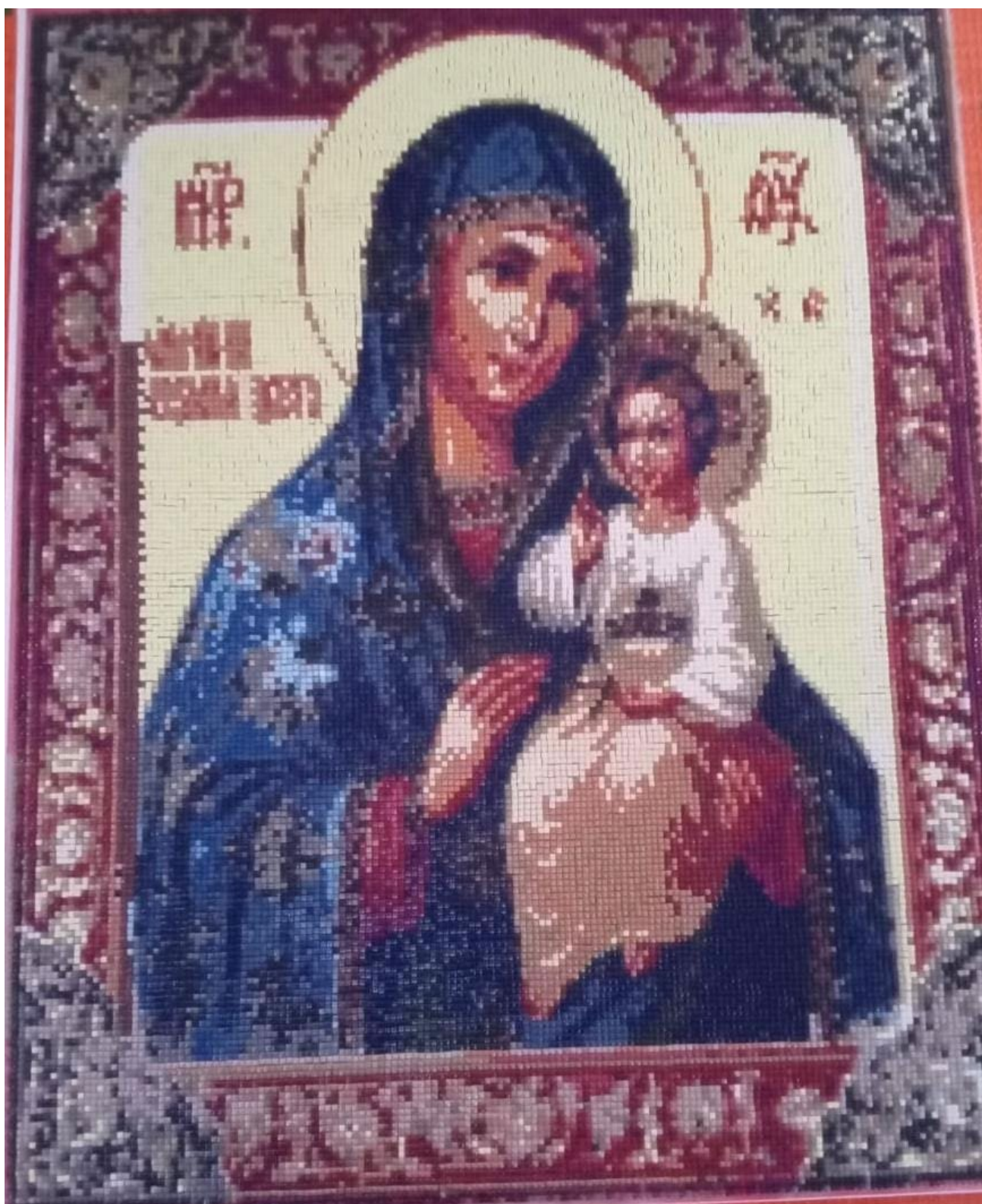
Фото картины «Владимирская Богоматерь» с алмазной обработкой