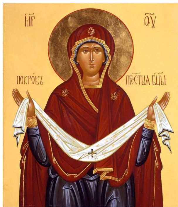
«Покров Пресвятой Богородицы»