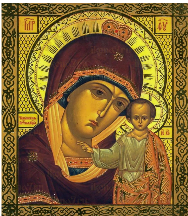
«Табынская икона Божией Матери»