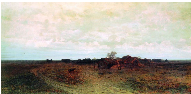
Картина А.И. Куинджи «Забытая деревня» (1874, Третьяковская галерея, холст, масло)

Фотокопия (воспр. по изд.: Неведомский М.П., Репин И.Е. Куинджи. СПб., 1913).