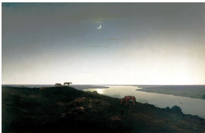
Картина А.И. Куинджи «Ночное» (1908, Русский музей, холст, масло)