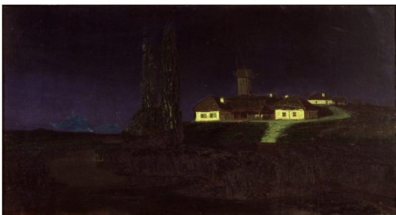
Картина А.И. Куинджи «Украинская ночь» (1876, Третьяковская галерея, холст, масло)