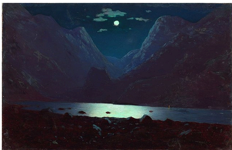
Картина А.И. Куинджи «Дарьяльское ущелье» (1890, Третьяковская галерея, картон, масло)