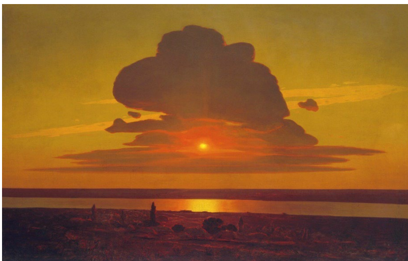
Картина А.И. Куинджи «Красный закат» (1908, Метрополитен-музей, холст, масло)