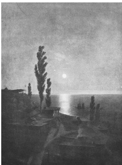
Картина А.И. Куинджи «Татарская деревня при лунном освещении на Южном берегу Крыма» (1868, местонахождение неизвестно)