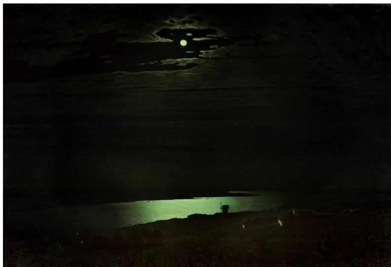
Картина А.И. Куинджи «Лунная ночь на Днепре» (1880, Русский музей, холст, масло)