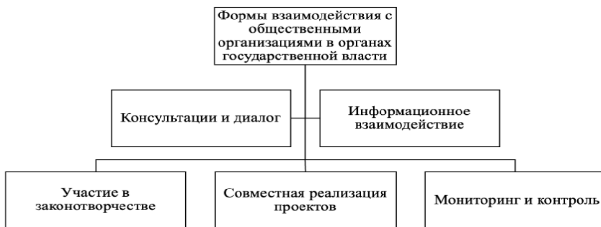
Рисунок 1 – Формы взаимодействия с общественными организациями в органах государственной власти

На рисунке 1 представлены формы взаимодействия с общественными организациями в органах государственной власти.