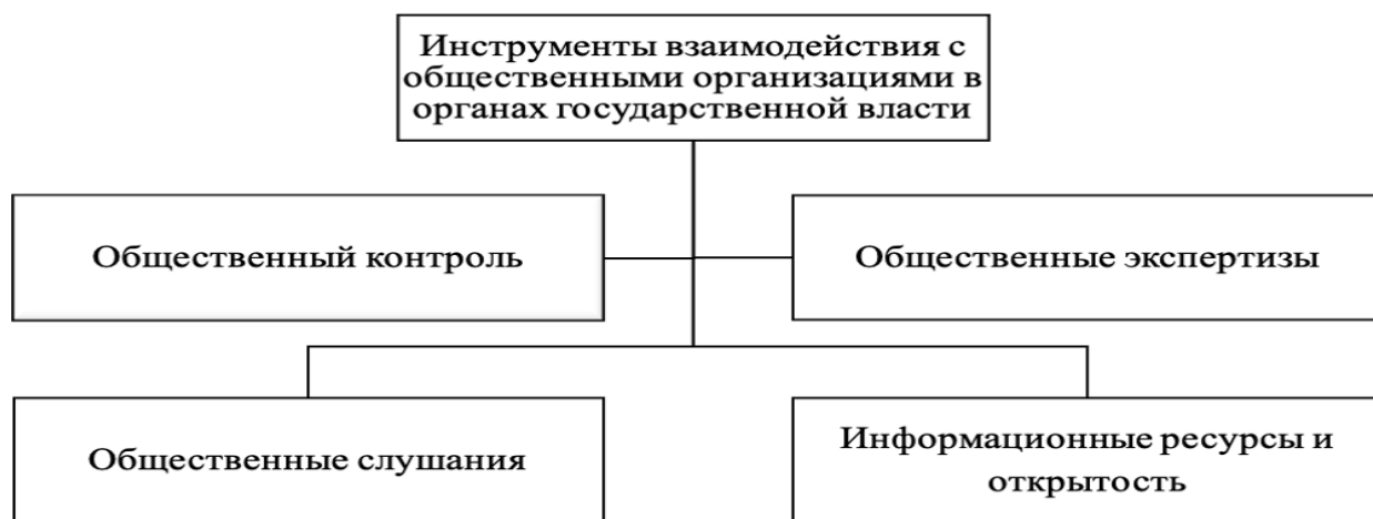
Рисунок 2 – Основные инструменты взаимодействия с общественными организациями в органах государственной власти

На рисунке 2 представлены основные инструменты взаимодействия с общественными организациями в органах государственной власти.