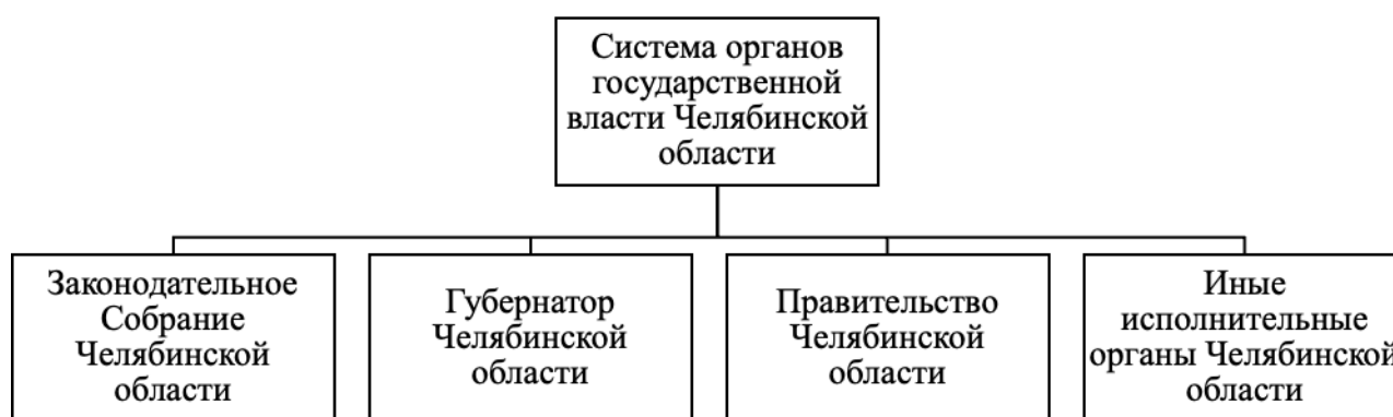
Рисунок 3 – Система органов государственной власти Челябинской области

На рисунке 3 представлена система органов государственной власти Челябинской области.